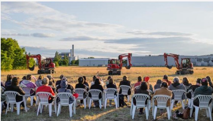
Kurator beim Festival OSTEN: Die Performance „Baggern“ von Studio Urbanistan beschäftigt sich mit Mutterschaft und Arbeit und fand auf der Brache eher ehemaligen Filmfabrik statt.

Aus dem Studienprojekt entwickelte sich für mich ein Engagement als Mitarbeiter in der Produktion für das Festival. Und auch nach der ersten Festivalausgabe bestand der beidseitige Wunsch der weiteren Zusammenarbeit.