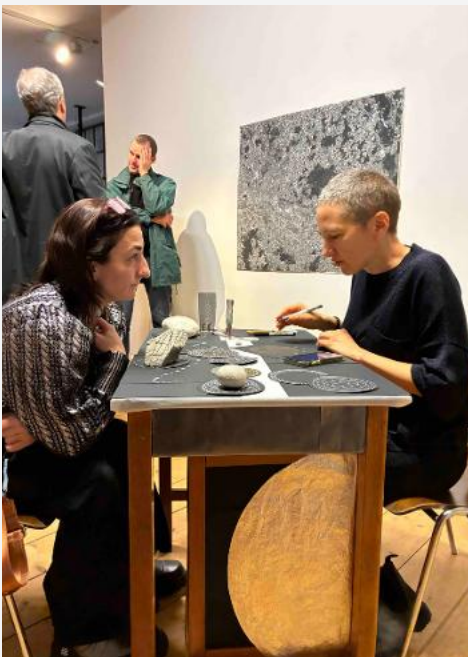
© Moon Reading Rebecca Beachy