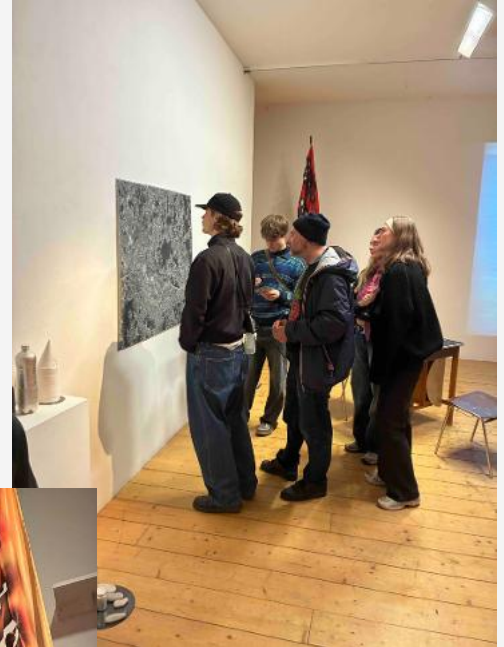
© Installation Rebecca Beachy mit Besuchenden Foto Kerstin Niemann