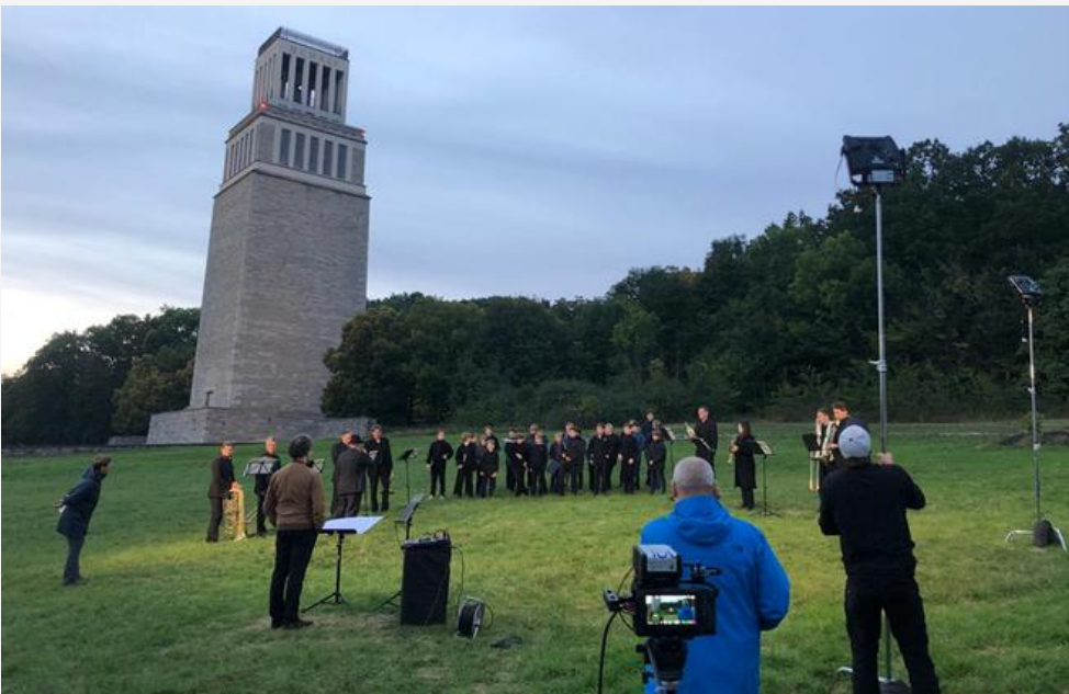
Als Produktionsmager bei YMUSIC: Mitglieder der Staatskapelle Weimar und des Jenaer Knabenchors auf dem Ettersberg nahe der KZ-Gedenkstätte Buchenwald, 2021, @ Martin Naundorf

Die erste berufliche Station nach dem Bachelorabschluss führte mich 2019 zum Kunstfest Weimar, bei dem ich bereits mein Praxissemester im Sommersemester 2018 absolviert hatte. Besonders die genreübergreifende Arbeit und die Verbindung zwischen der freien Szene und dem Stadttheaterbetrieb interessierte mich. In Weimar lernte ich als Produktionsassistent zudem die Festivalarbeit schätzen.