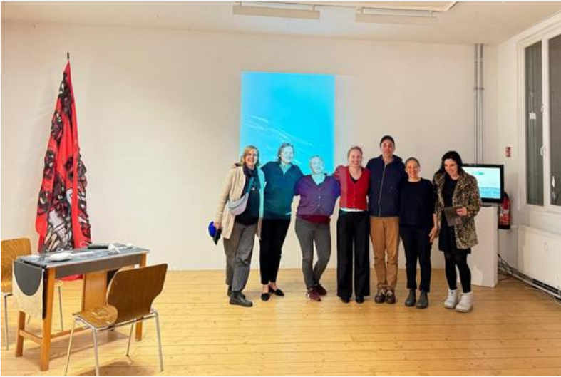
© Eröffnung mit Kuratorinnen und Künstler*innen, Foto Tilman Terbuyken