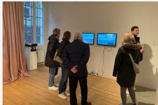
© Exhibition view, Foto Tricia Van Eck

Diese transatlantische Gruppenausstellung brachte Künstler*innen aus Chicago, Detroit und Hamburg zusammen und thematisierte, wie Wasser, Klang und Wetter die urbane Umgebung prägen.