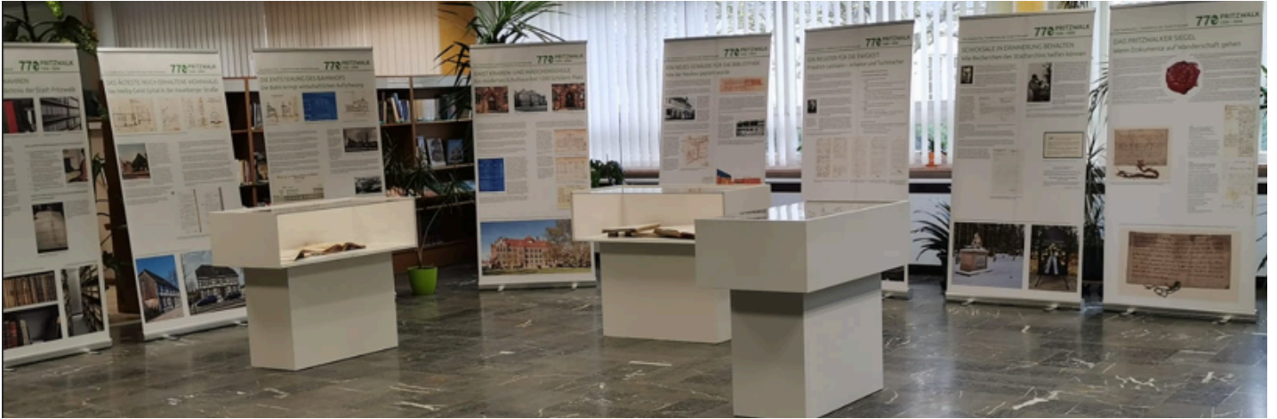
Archivausstellung in Pritzwalk

Unter dem Titel „Das Stadtarchiv – Gedächtnis der Stadt Pritzwalk“ eröffnete das Archiv eine Ausstellung, die noch bis zum Jahresende in der dortigen Stadtbibliothek gezeigt wird. Bereits am Eröffnungstag fand die Ausstellung großes Interesse. Zum Weiterlesen hier .