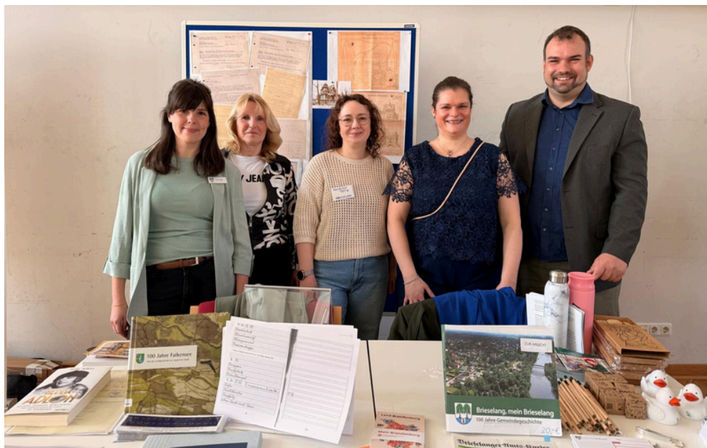
Die Kolleg*innen aus dem Landkreis Havelland 2026

Mit der erstmaligen gemeinsamen Präsentation der havelländischen Archive setzte die Veranstaltung ein deutliches Zeichen für Zusammenarbeit und die Vermittlung regionaler Geschichte. Die durchweg positive Resonanz der Besucherinnen und Besucher zeigte einmal mehr: Das Interesse an historischen Quellen und regionaler Identität im Havelland ist ungebrochen. Weitere Informationen hier .